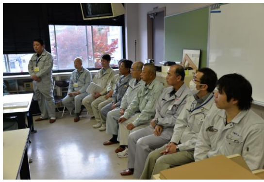
高度熟練技能者様