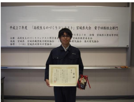
表彰式後の記念撮影